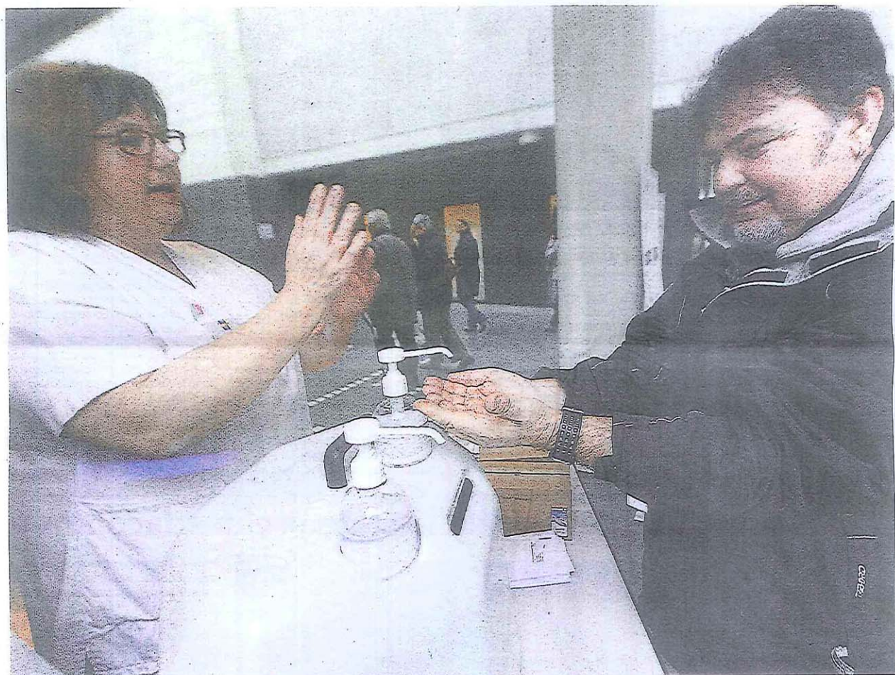
Le Mans, Pôle santé Sud, hier. Se laver les mains, oui, mais pas n'importe comment.

L'épidémie est arrivée en France au début de l'année, mais n'a pas encore vraiment atteint notre département. Les professionnels rappellent quelques conseils simples pour éviter la propagation.